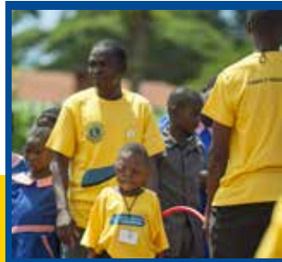
Bir Futbol Günü, Futbol ve Dahil Olma