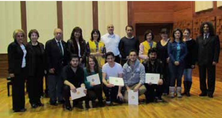
Yarışmacılar jüri üyeleri ve görevliler toplu halde Adnan Saygun salonunda