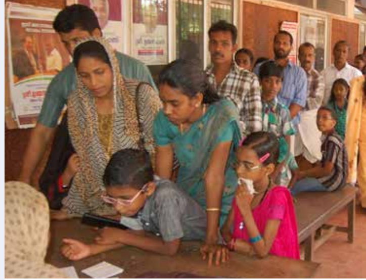
Hindistan – Kerela'da öğrenciler “Çocuklar İçin Göznuru” programı kapsamında ücretsiz göz taraması için kayıt oluyorlar.