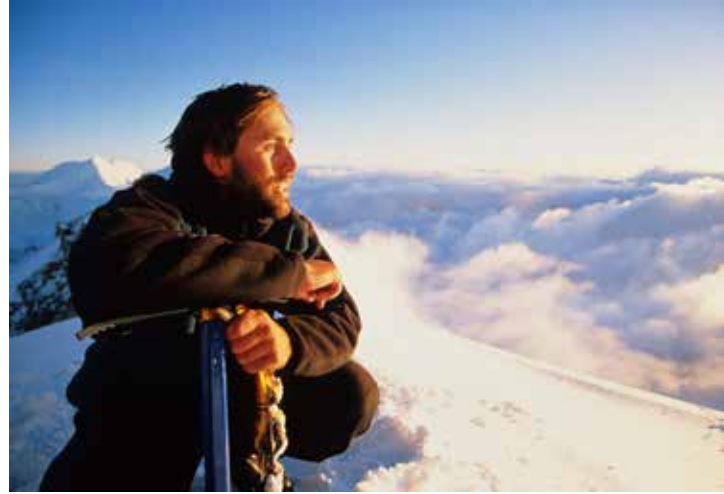
Erik Weihenmayer Alaska'da McKinley dağının zirvesinde